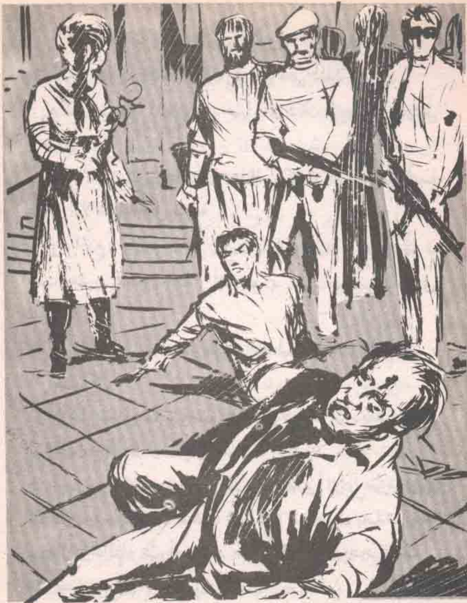
رفعت (كارولينا) مسدسًا ذهبيًا ، وأطلقت منه رصاصة واحدة ، استقرت بين عيني (أماريلو) ، الذي جحظت عيناه ..

كان (أدهم) يتصور أن (كارولينا) مجرد مراهقة ، تحاول القيام بدور الزعيمة ، إلا أنها بدت أهلاً لهذا الدور ، حينما قاطعت (أماريلو) في صرامة ، وصوت قاس ارتجف له هذا الأخير ، على الرغم من شراسته :